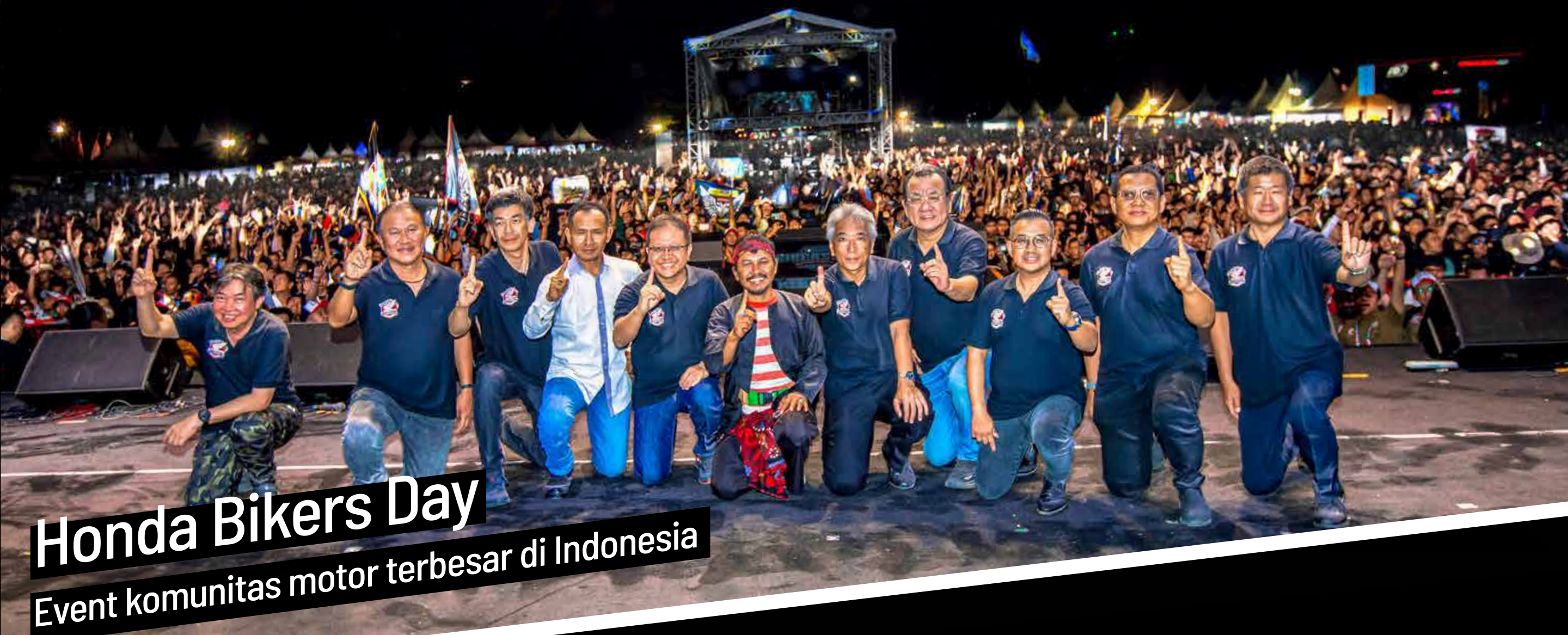
Honda Bikers Day Event komunitas motor terbesar di Indonesia